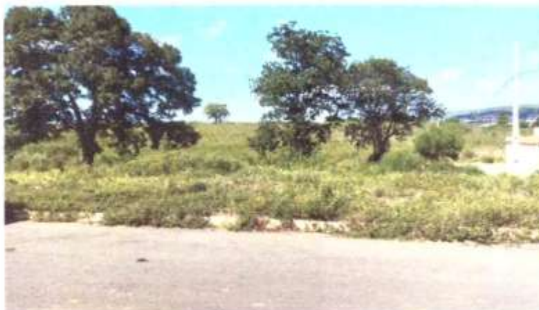
Vista Frontal do Terreno

Secretaria de Desenvolvimento Urbano e Obras Públicas