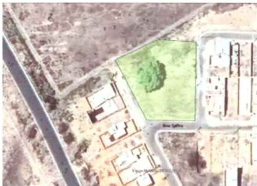
Vista Aérea do Terreno

A vistoria do imóvel foi feita pela Comissão no dia 18 de abril do corrente ano.